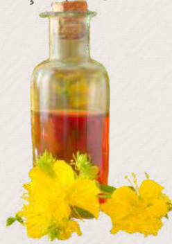
KIRMIZI KANTARON YAĞI