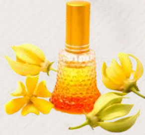
YLANG YLANG YAĞI