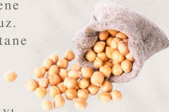
7 ADET NOHUT