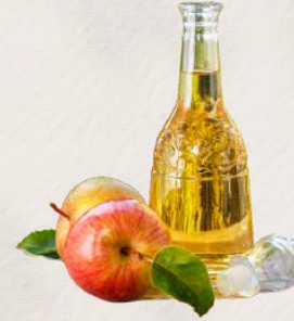
ÜZÜM VEYA ELMA SİRKEŞİ