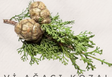
SELVİ AĞACI KOZALAĞI