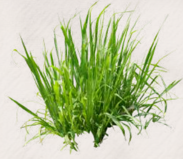
100 GR ÇİMEN