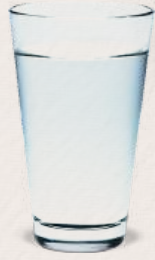
BİR BARDAK SU