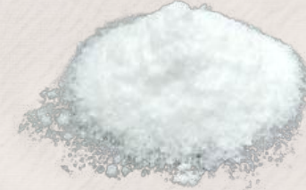
TUZ (KAYA TUZU)