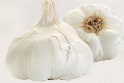
KASTAMONU TAZE SARIMSAK