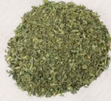
ISIRGAN OTU TOHUMU